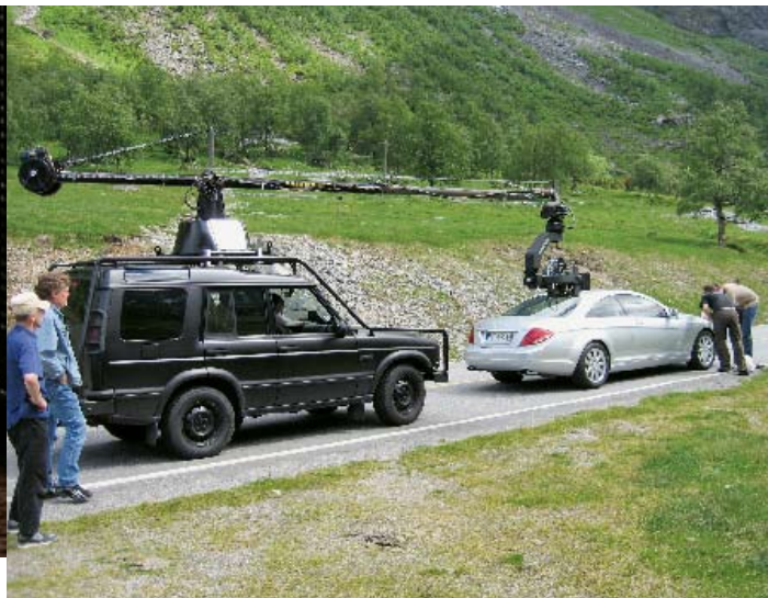
Der Kamerawagen mit dem Russian Head Crane. Die schwarze Lackierung hilft, störende Reflexionen zu vermeiden