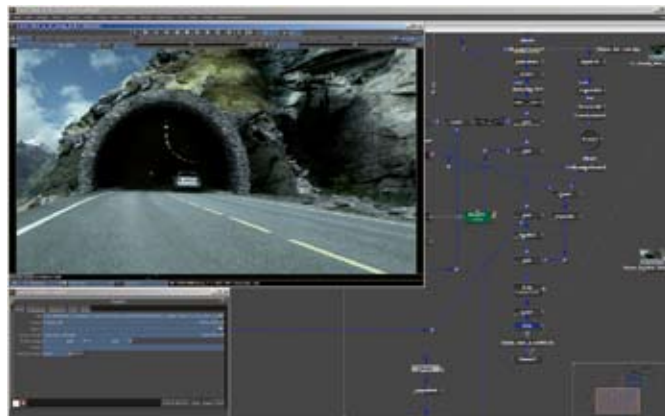
Set Extension der Tunnelszene. Nur der Wagen und die Straße blieben von der ursprünglichen Filmaufnahme übrig

einfachen Zusammenschnitt von Filmaufnahmen und gerenderten Bildern hinaus. So erstreckte sich die Nachbearbeitung bei Macke-vision auf alle Facetten der Motive sowie auf das Generieren des schwarz lackierten Fahrzeugs und dessen Umgebung. Zunächst galt es, das Realfilmmaterial zu bearbeiten. Dabei sollte eine mys-tisch anmutende Umgebung geschaffen werden, um die Eleganz und Exklusivität des Fahrzeugs zu unterstreichen. In ausgewählten Einstellungen passte das Team die abseits gelegene, recht ver-lassen anmutende Landschaftskulisse dem durch Scribbles und Storyboard vorgegebenen Stil an und baute digitale Set Extensions ein. Elemente wie Himmel, Berge, Täler, Felsen und Architektur wurden verändert beziehungsweise hinzugefügt und unerwünschte Verkehrsschilder entfernt oder modifiziert. Neben der Set Extension fand auch ein Set Replacement statt. So ersetzte das Team beispielsweise störende Steinwälle am Horizont neben der Brücke durch gestalterisch besser passende Landschaftsteile.